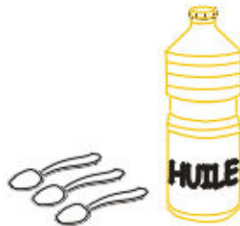
3 cuillères d'huile